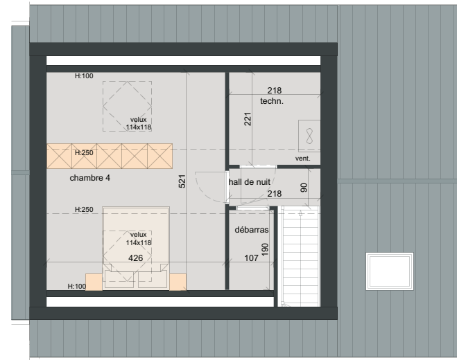
DEUXIÈME ÉTAGE SURF. = ± 38 m 2