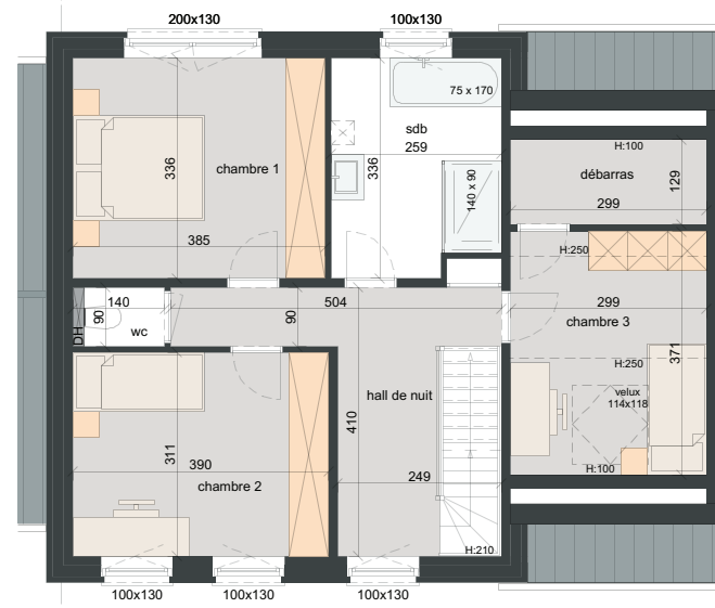
PREMIER ÉTAGE SURF. = ± 76 m 2