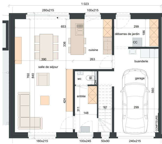
REZ-DE-CHAUSSÉE SURF. = ± 86 m 2