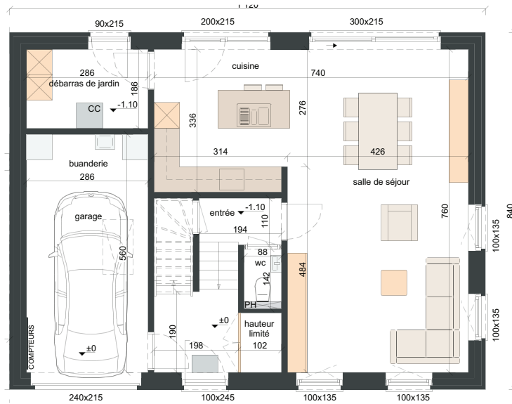
REZ-DE-CHAUSSÉE SURF. = ± 94 m 2