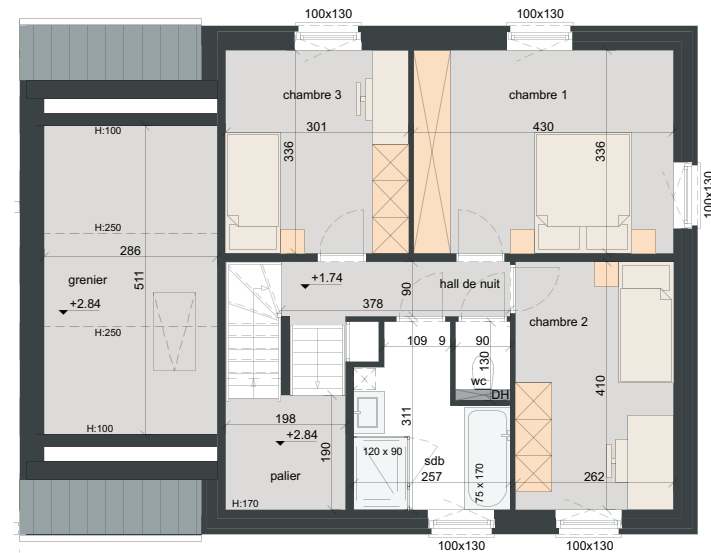
PREMIER ÉTAGE SURF. = ± 83 m 2