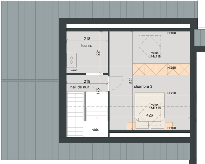
DEUXIÈME ÉTAGE SURF. = ± 37 m 2