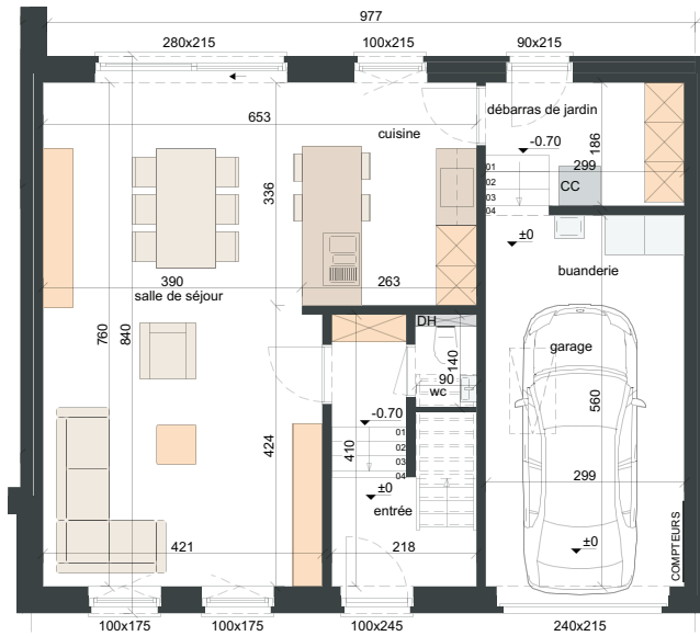
REZ-DE-CHAUSSÉE SURF. = ± 84 m 2