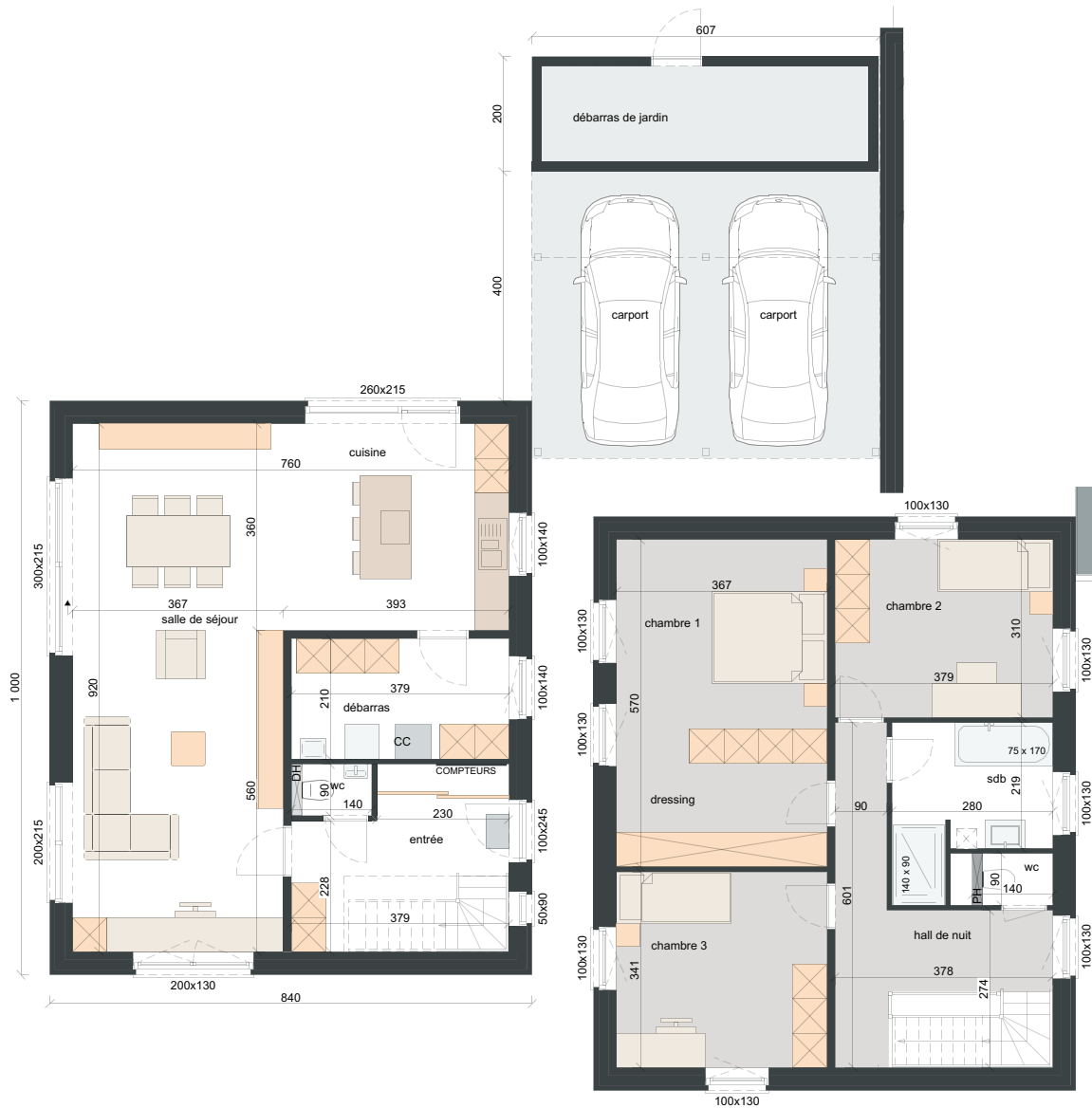
REZ-DE-CHAUSSÉE SURF. = ± 84 m 2