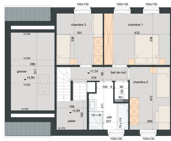
PREMIER ÉTAGE SURF. = ± 81 m 2