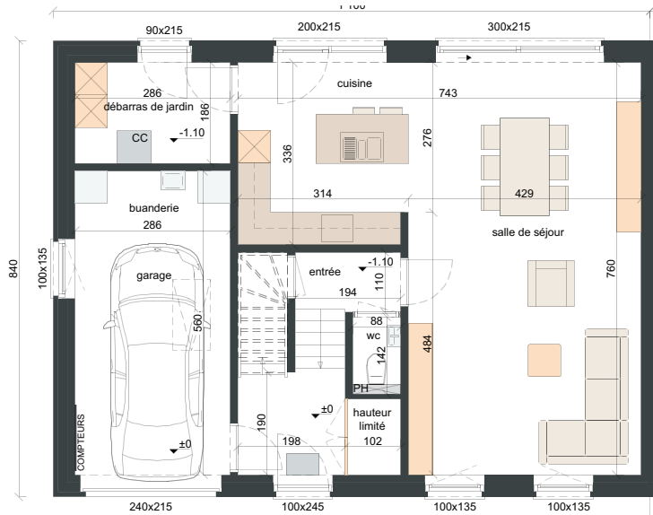
REZ-DE-CHAUSSÉE SURF. = ± 92 m 2