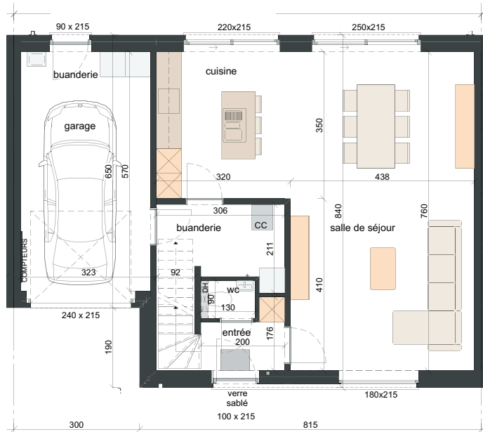
REZ-DE-CHAUSSÉE SURF. ± 88M 2