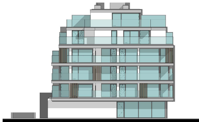
VOORGEVEL - SMEYERSLAAN