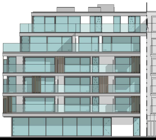
VOORGEVEL - STRANDLAAN